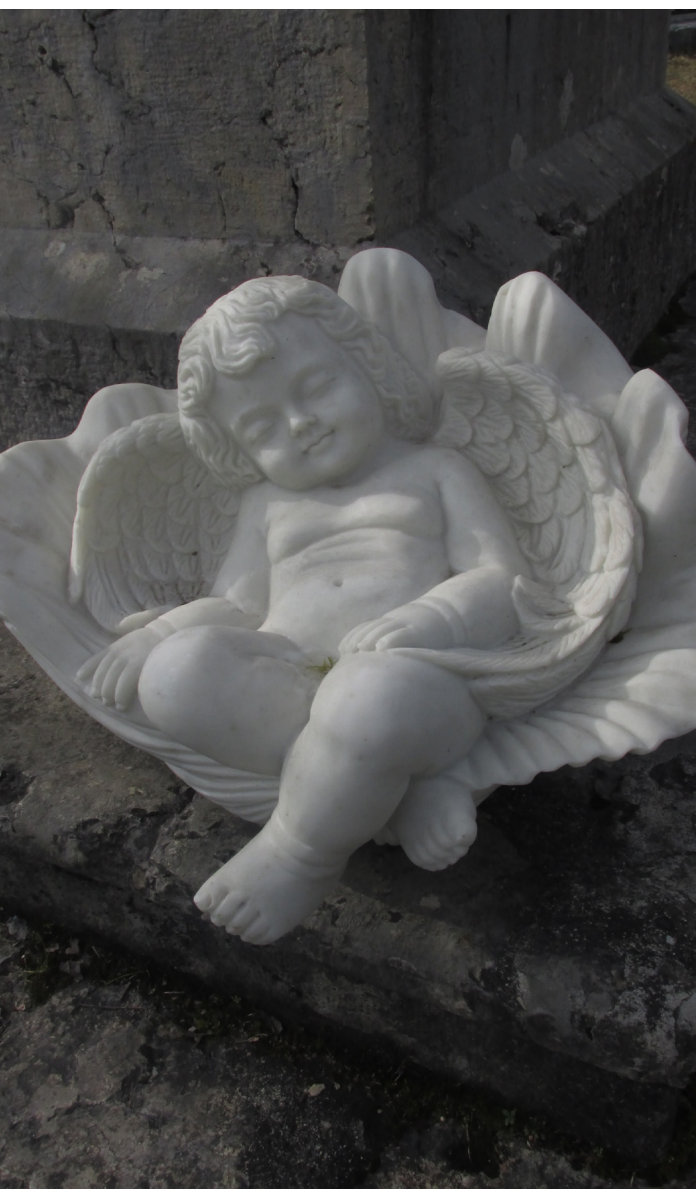
L'identité jurassienne à travers les regards de la classe Merguin 3.

La Fondation Pérène est une fondation privée au sens des articles 80 et suivants du Code Civil Suisse reconnue d'utilité publique. Elle est placée sous la responsabilité formelle, juridique et financière du Canton du Jura par le Département de la formation, de la culture et des sports.