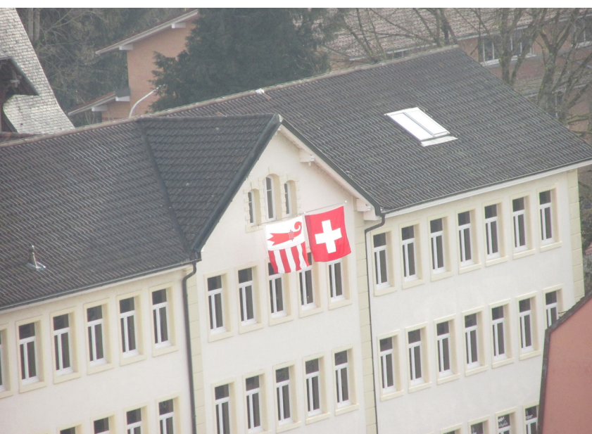
L'identité jurassienne à travers les regards des élèves de la classe Merguin 3

Le samedi 25 mai 2024, les élèves ayant participé aux activités des classes artistiques ont donné rendez-vous à leurs familles dans les locaux de Circosphère. Accompagnés de leurs éducateurs et enseignants, ils ont démontré leurs talents dans des jeux d'adresse et d'équilibre. Cette journée, placée sous le signe de l'intégration et de la participation, faisait partie d'un concept global élaboré par le Service de l'action sociale dans le cadre des journées nationales d'action pour les droits des personnes en situation de handicap. De nombreux événements ont été organisés en Suisse et dans le Jura sous la bannière «Avenir inclusif». Ils ont contribué à marquer les 10 ans de la ratification par la Suisse de la CDPH (Convention relative aux droits des personnes handicapées de l'ONU).