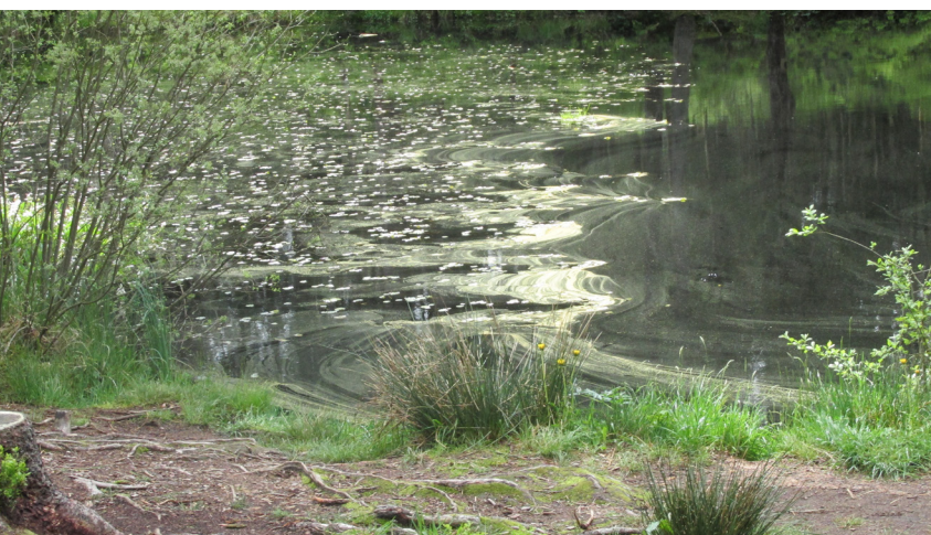
En balade aux étangs de la Gruère

Responsable du secteur des services financiers