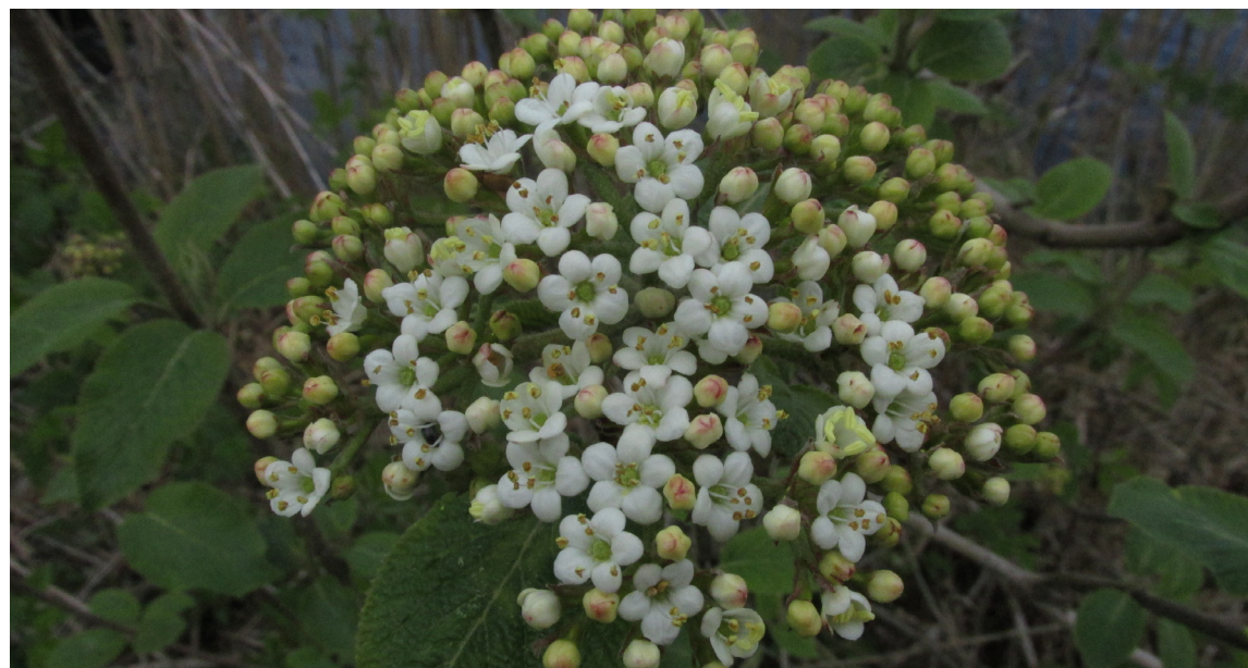
En balade aux étangs de la Cruère