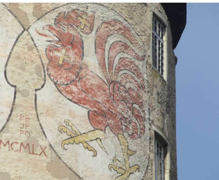
L'identité jurassienne à travers les regards des élèves de la classe Merguin 3

La question de l'accueil résidentiel d'un élève admis en scolarisation à la Fondation est à traiter directement avec l'institution et n'entre pas dans le cadre de la PES.