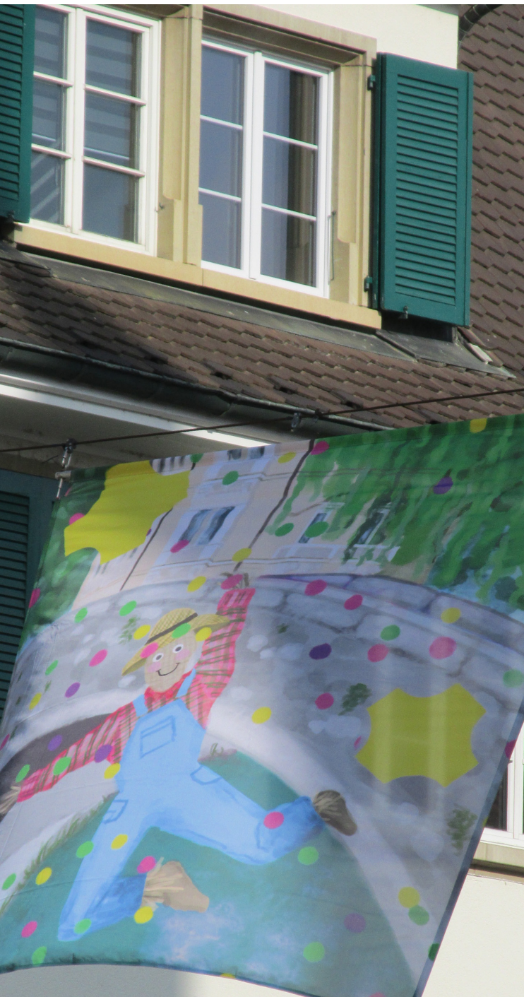
L'identité jurassienne à travers les regards des élèves de la classe Merguin 3

« Confrontée à une hausse de ses effectifs élèves et tel que pressenti depuis deux ans déjà, la Fondation a vu ses réserves financières fondre comme neige au soleil. »