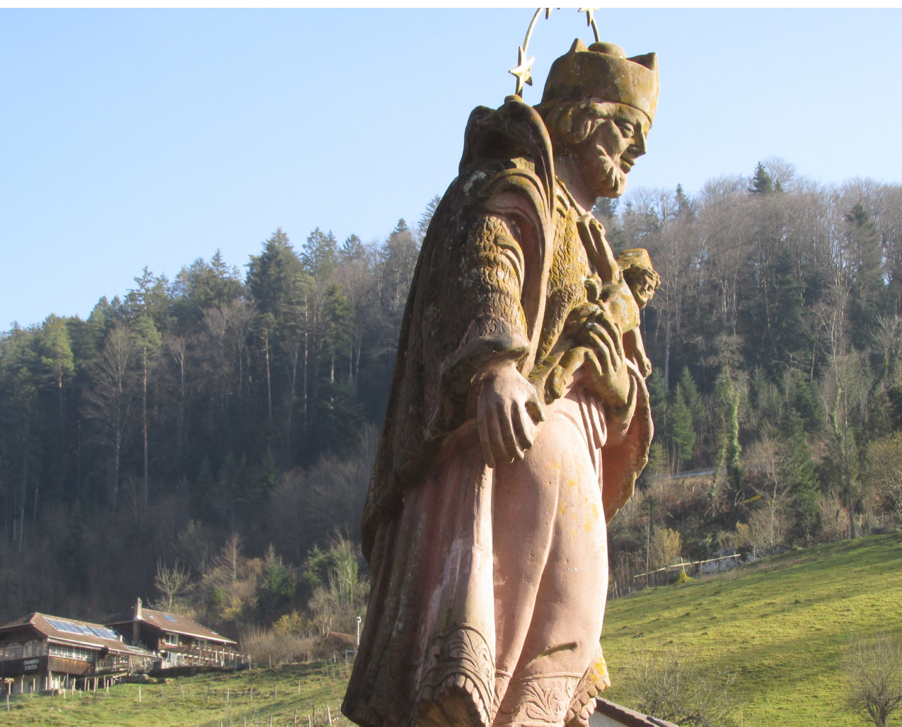
L'identité jurassienne à travers les regards des élèves de la classe Merguin 3

Intérêt supérieur de l'élève – Intégration et participation – Acteurs de la société – Respect de la personne – Accès à l'apprentissage et à l'éducation – Partenariat avec les parents – Professionnalisme